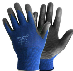
Schutzhandschuh S380 29.014