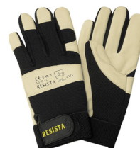
Schutzhandschuh RESISTA 29.004