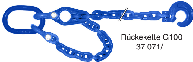
Rückekette G100 37.071/..