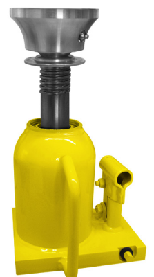
Fällheber hydraulisch 24.255